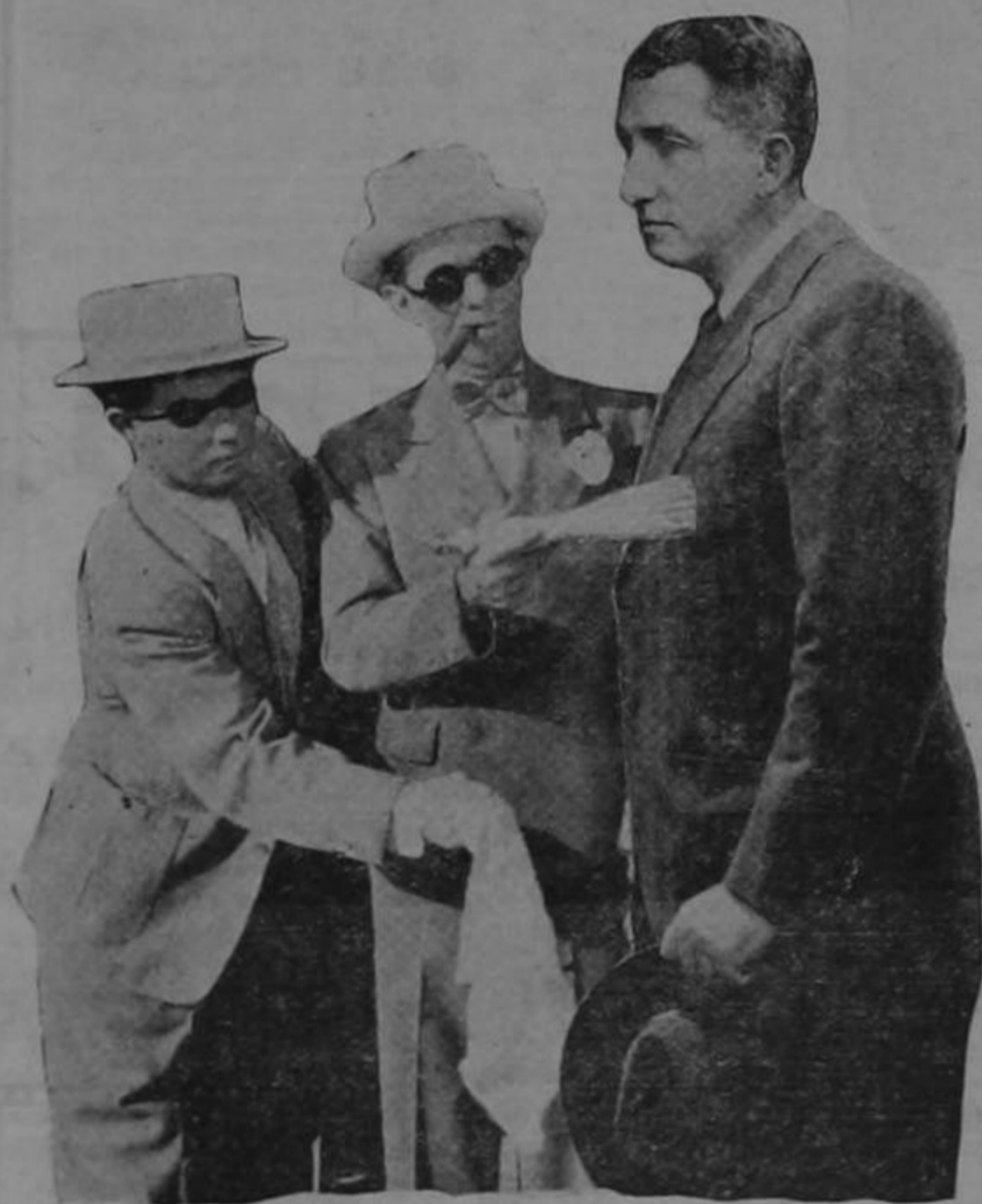
¡Recibo este homenaje porque se le otorga al más humilde maestro de escuela!